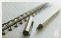
table des matières contents